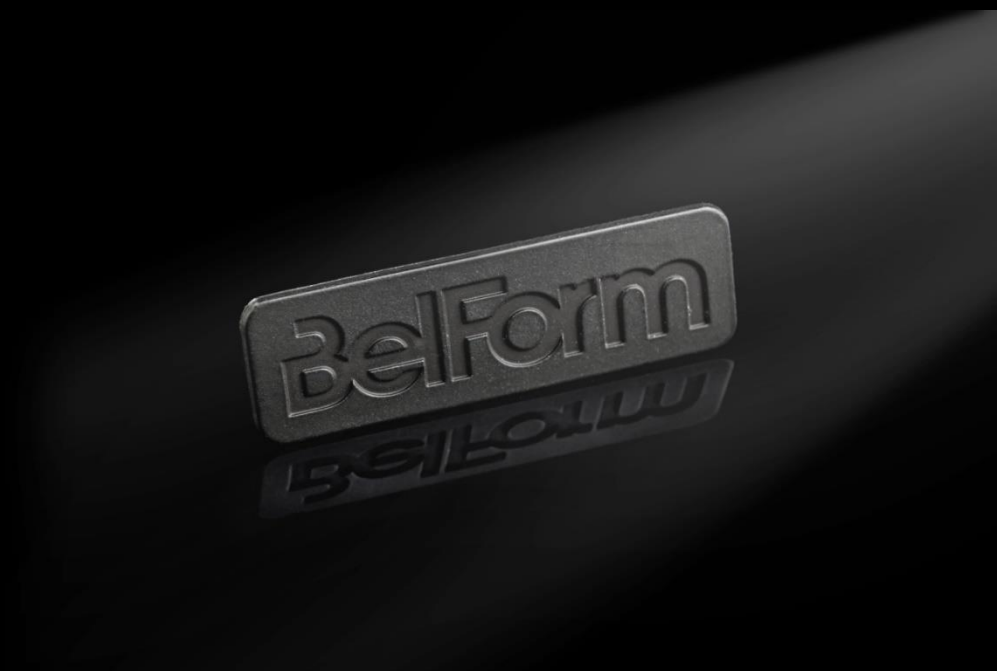
Möbel-Emblem mit FINELINE Oberfläche Ton in Ton, Emblem wird in eine Vertiefung eingeklebt.