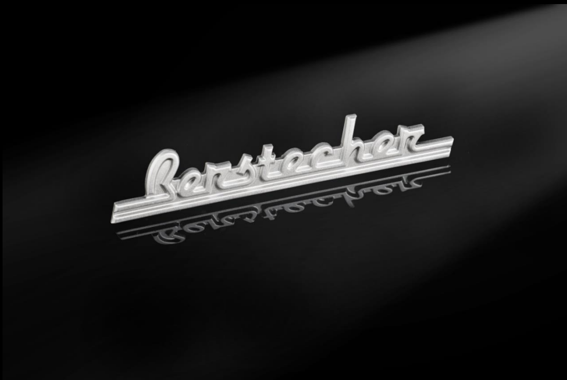
Gitarren-Emblem mit FINELINE Oberfläche und Befestigungstechnik Lokxx® .