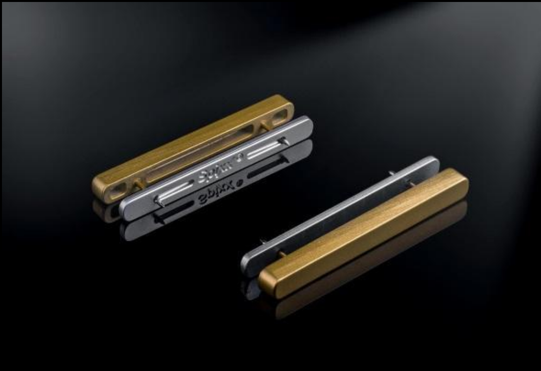
Taschengriffstück mit FINELINE Oberfläche und Befestigungstechnik Spixx® .