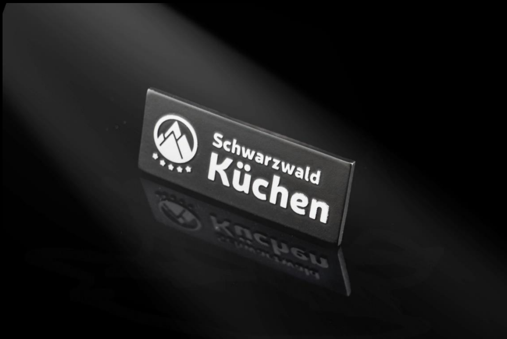
Küchen-Emblem mit FINELINE Oberfläche, Rückseite mit doppelseitigem Klebeband.