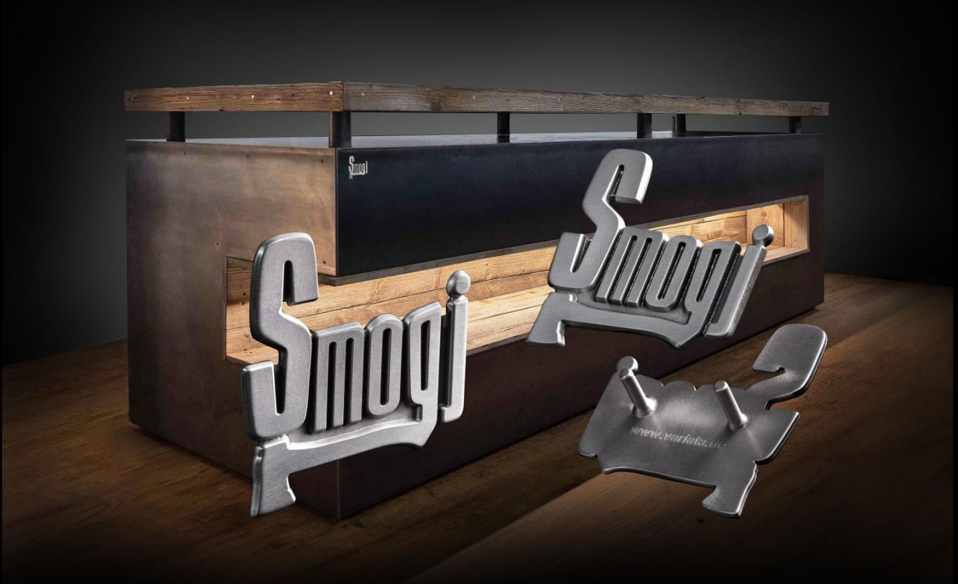
Holz­möbel-Emblem mit Befestigungstechnik Glixx® .